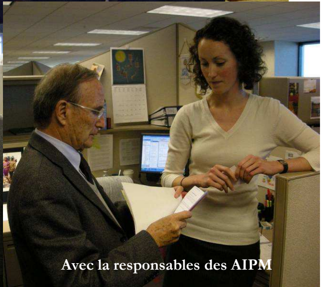
Avec la responsables des AIPM

Extrait du journal du club de New York à l'occasion du Marathon du 2 novembre 2008