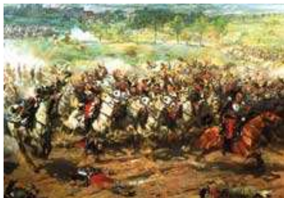
La charge des cuirassiers 6 août 1870 Aimé Morot