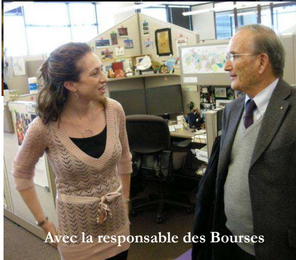
Avec la responsable des Bourses