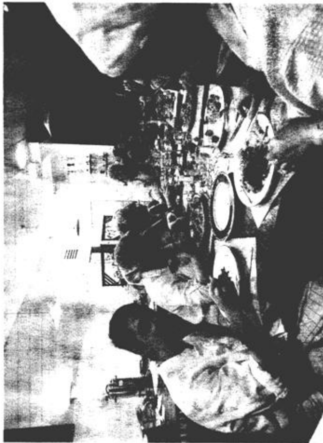
L'équipe de Mosaïque, un restaurant d'insertion et traiteur original et accueillant.

www.mosaïque-restaurant.com 03 88 39 05 16, 23, rue du Marschallhof, ouvert de 8h30 à 16h30, commandes aussi par courriel : mosaïque.direction@orange.fr