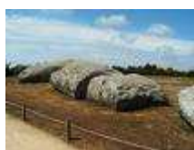
Le grand menhir brisé de Locmariaquer (Sur de.wikipedia.org/wiki/Menhir .)

Petit éveil à la curiosité ; 4500 ans avant J.C. à l'entrée du Golf du Morbihan un petit port de pêche – Locmariaquer – se dressait le plus grand menhir en Europe, en granit à gros grain, 20 m de haut – 280 tonnes, début d'un alignement comme à Carnac. Peut-on déjà parler d'une première civilisation qui serait née le long des côtes atlantiques ?